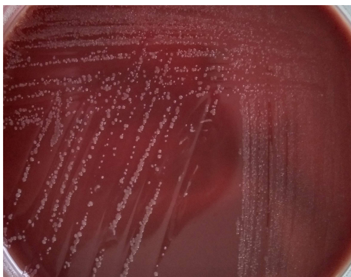
Figura 2 Crecimiento de Neisseria gonorrhoeae en Agar Chocolate.

a una infección diseminada [6,7]. Generalmente, la artritis es monoarticular y predomina en las rodillas, los codos o las muñecas [3]. A pesar de que los síntomas son graves, con el tratamiento antibiótico adecuado y el drenaje de la articulación, el pronóstico de la artritis es favorable evitando que se pierda funcionalidad. Los hemocultivos no suelen positivizarse en estos casos de artritis gonocócica [8].